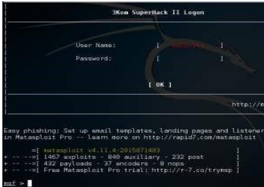
Figura 5. Consola msfconsole.

En la Figura 5, se muestra la consola msf. Para ingresar a la consola de metasploit se ejecuta el comando: #msfconsole